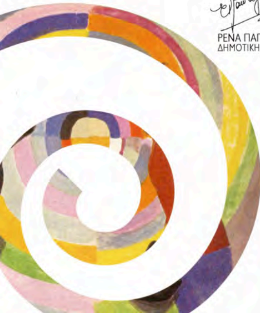
ΡΕΝΑ ΠΑΠΑΓΕΩΡΓΙΟΥ ΔΗΜΟΤΙΚΗ ΣΥΜΒΟΥΛΟΣ